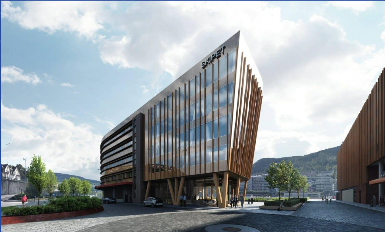
Kontorbygget Skipet 2019