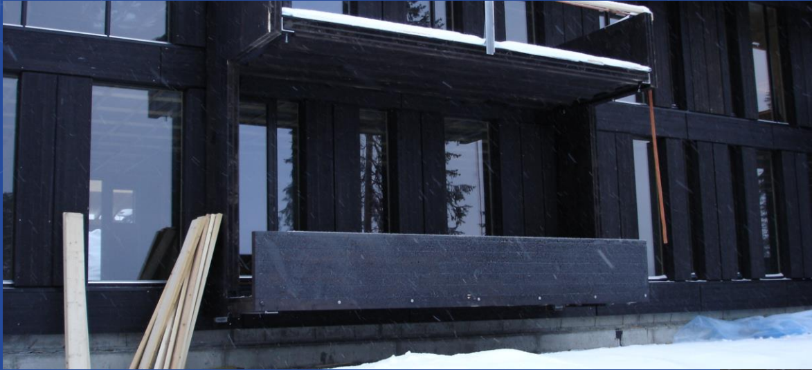
Kvitfjell balkonger 2007